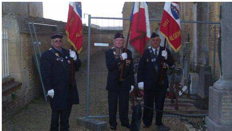
Les porte-drapeaux près du monument pour fêter le centenaire .