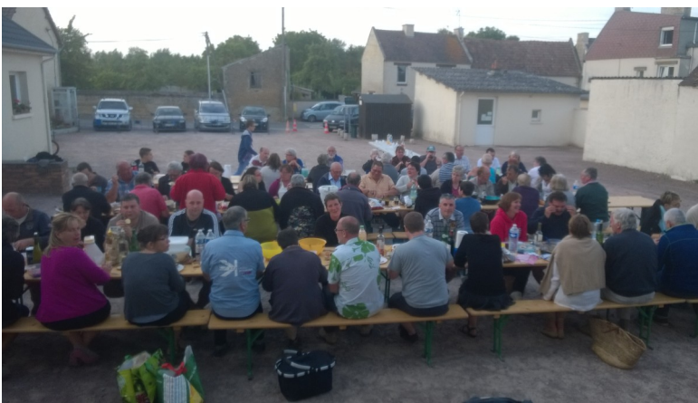
Les chichebovillais rassemblés

Le samedi 21 juin dernier, les Associations de CHICHEBOVILLE (l'Association de Chasse, l'Association de Sauvegarde de la Chapelle, l'Association Familles Rurales, l'Association Parents d'Elèves et l'Association Chibeau Fleuri) ont convié les habitants de la commune à la « Fête des Chichebovillais ». Dans l'esprit de la fête des voisins, 90 personnes environ se sont retrouvées, vers 19 heures, sur la place de la Mairie pour fêter le début de l'été, tout en faisant connaissance et en échangeant. Des barbecues étaient mis à disposition pour les grillades, des tables et chaises avaient été installées, chacun amenant son pique-nique.