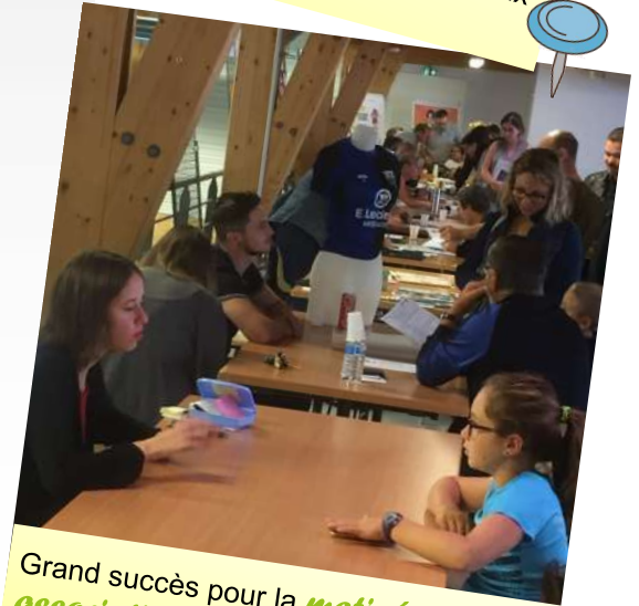
Grand succès pour la matinée des associations le 8 septembre à la salle multiraquettes.