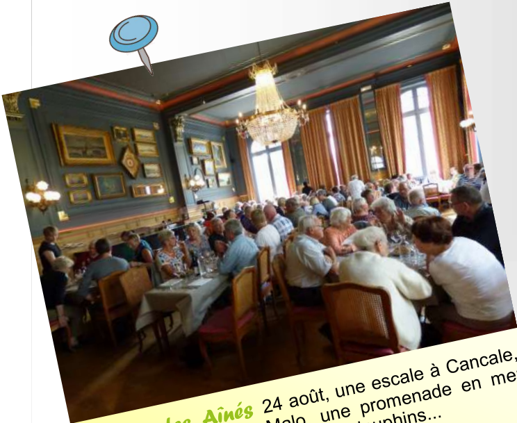
Voyage des Aînés 24 août, une escale à Cancale, un déjeuner à Saint Malo, une promenade en mer sous le soleil en compagnie des dauphins...