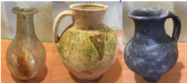
Conférence archéologique 16 septembre, Monsieur Lepaulmier, archéologue, a présenté ses recherches devant une cinquantaine de personnes. Cette conférence fait suite aux fouilles menées en 2014 sur le site du futur lotissement du Relais de Poste.