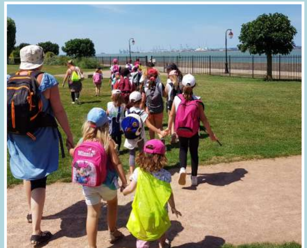
Bourses vacances , 42 enfants aidés par la mairie pour partir cet été au centre aéré ou en colonie de vacances.