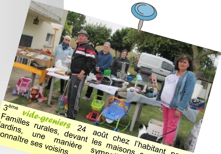
3 ème vide-greniers 24 août chez l'habitant pour Familles rurales, devant les maisons ou dans les jardins, une manière sympathique de mieux connaître ses voisins.